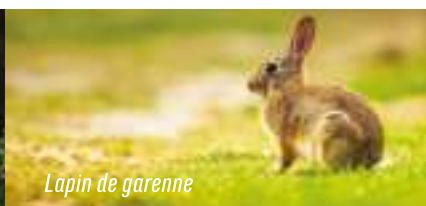
Lapin de garenne